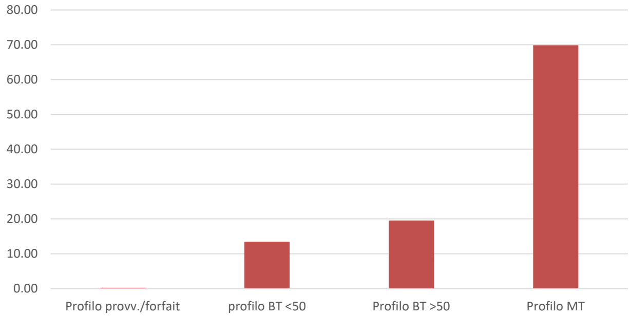
Erogazione nei profili d'utenza [GWh]